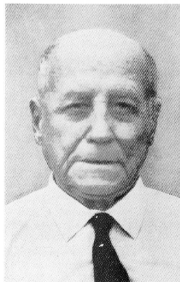
Prof. William Frederik Koch